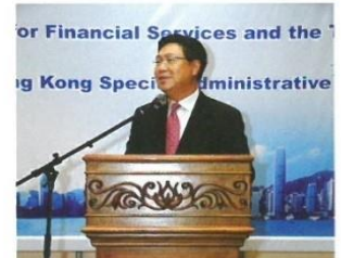
前財經事務及庫務局局長(現擔任商務及經濟發展局局長)馬時亨先生會上發表講話 Mr. Frederick Ma, Secretary for Financial Services and the Treasury HKSAR (now Secretary of Commerce and Economic Development), delivering speech at the conference.

The conference has reinforced the unique position of Hong Kong as an international capital information centre in Asia and helped to foster partnership in the financial service industry between Hong Kong and Kazakhstan.